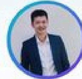
นายสินสิพันธ์ เร